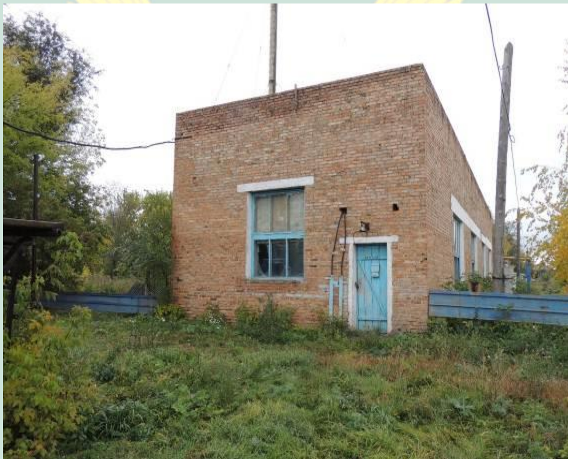
Рис. 11 – Здание газовой котельной с.Бугульчан