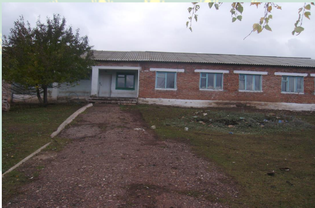
Рис. 4 – Здание школы д.Шюканово