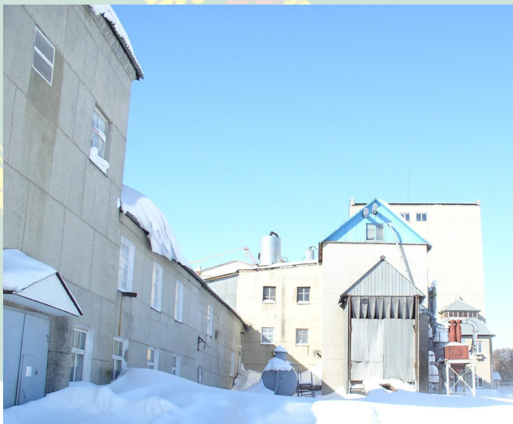
Рис.2 Ермолаевский спирто-водочный комбинат «Курьгаза»