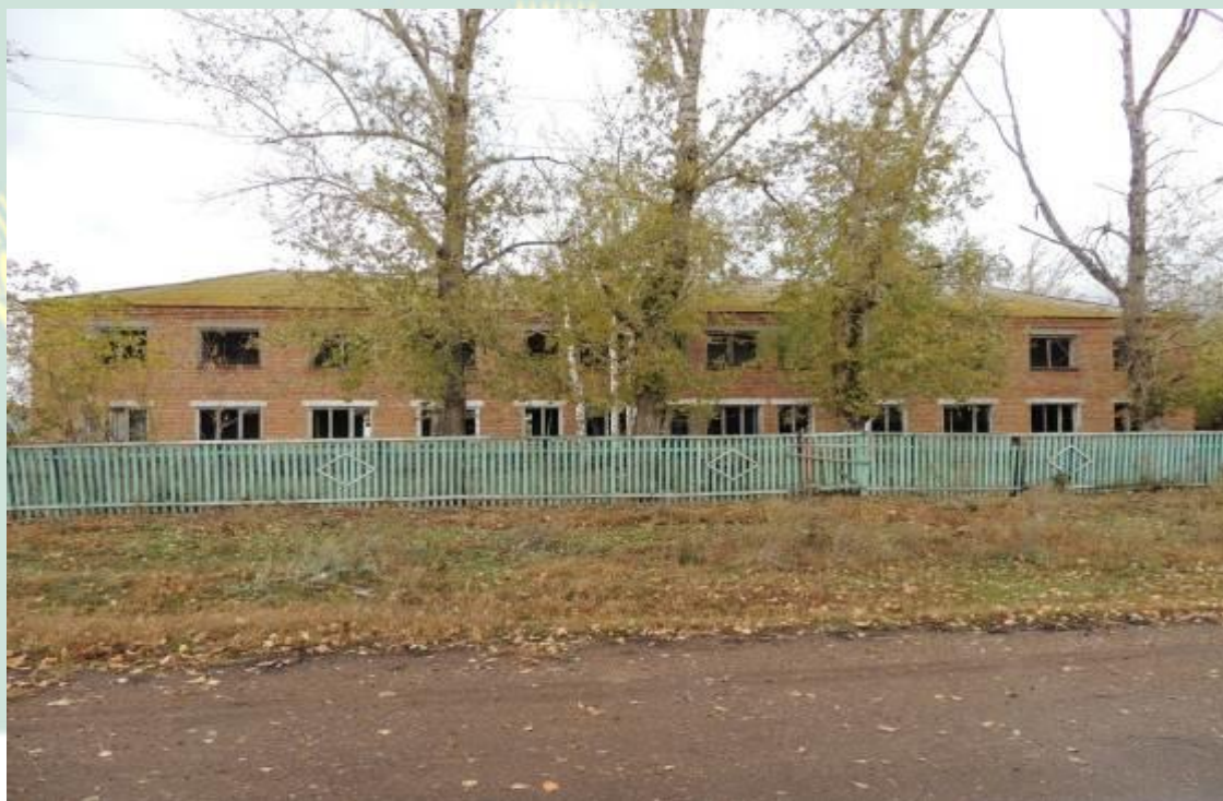
Рис. 8 - Здание интерната с.Новомурапталово