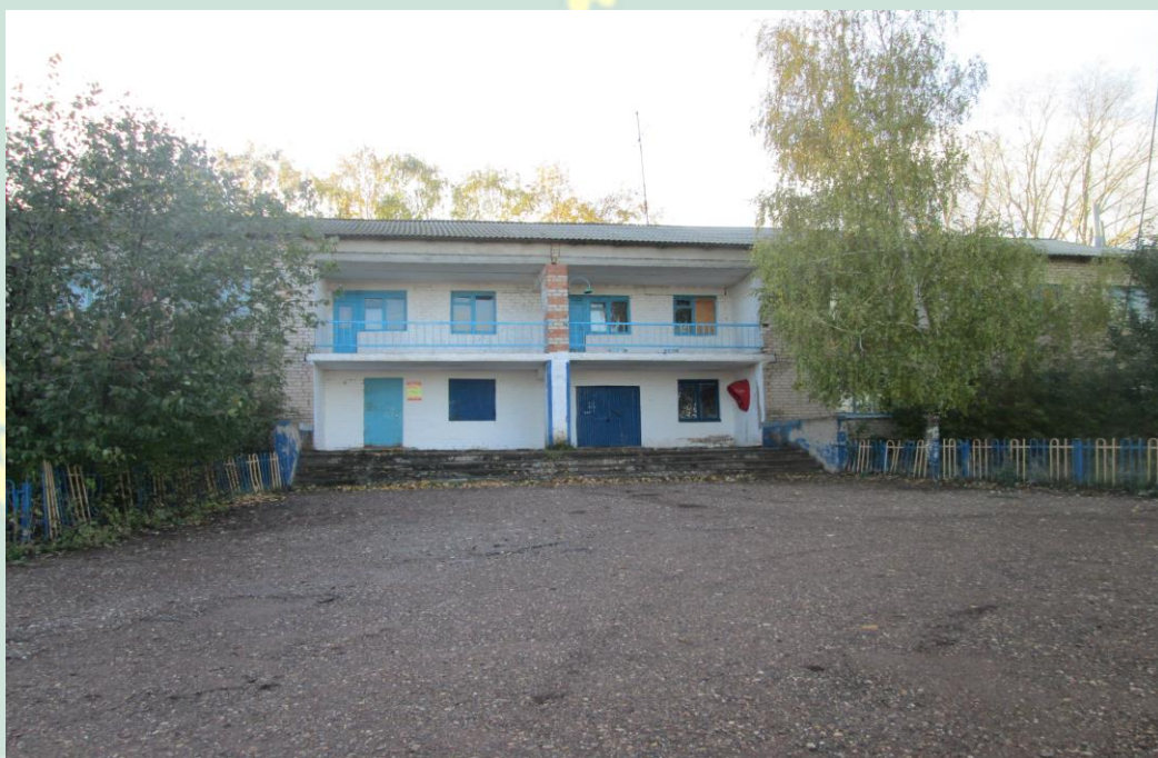
Рис. 6 Административное здание, контора 2-х этажное здание с.Свобода