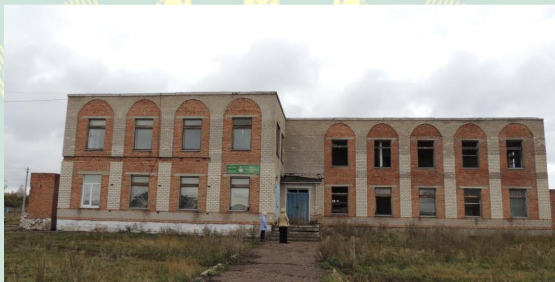
Рис.3 Здание общественного центра д.Новая Отрада