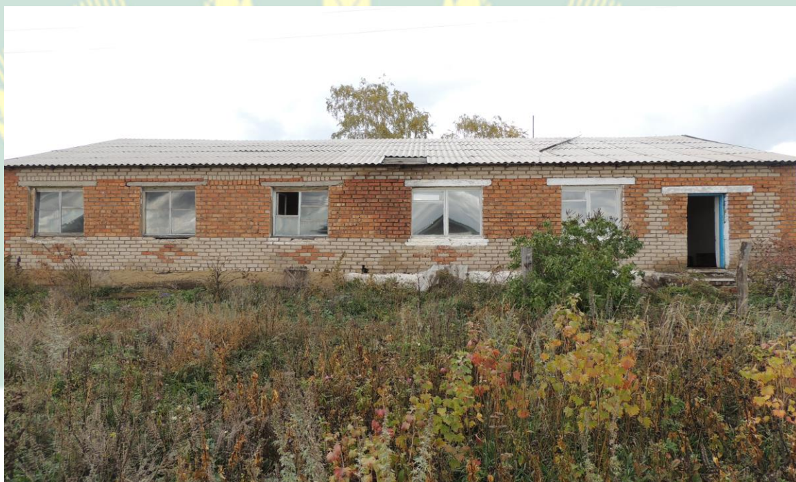
Рис. 7 Здание Красномаякского детского сада д.Красный маяк.