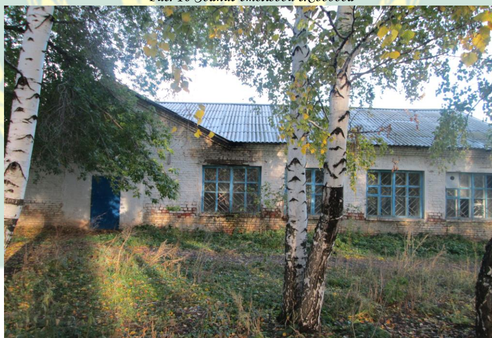
Рис. 10 Здание столовой с.Свобода