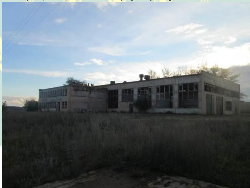
Рис. 5 Центральные-ремонтные мастерские, 2-х этажное здание с.Свобода