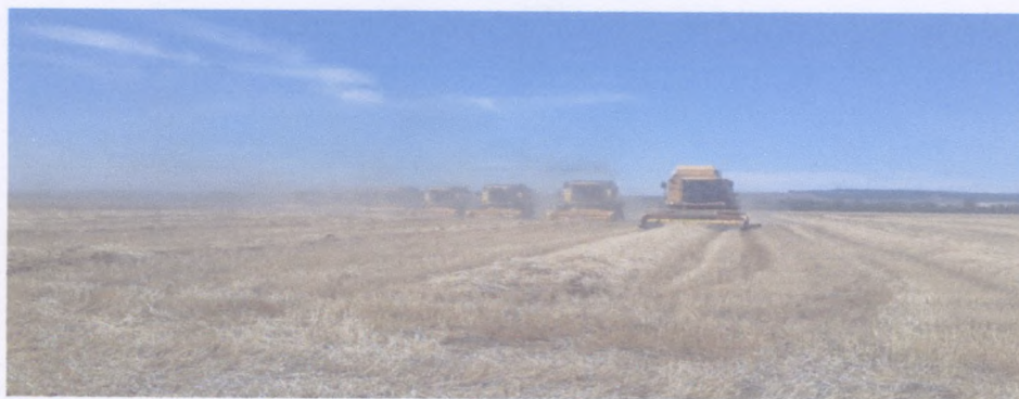
Рисунок 6 День поля 2018 год

В июле 2018 года ООО Маяк приобретены племенные нетели в количестве 165 голов из Германии на сумму более 26 млн. руб. Приобретены 2 ед. сельскохозяйственной техники на сумму 14 млн.руб. У СПК «Ильсегул» приобретены племенные нетели симментальской породы в количестве 50 голов из Аургазинского района РБ.