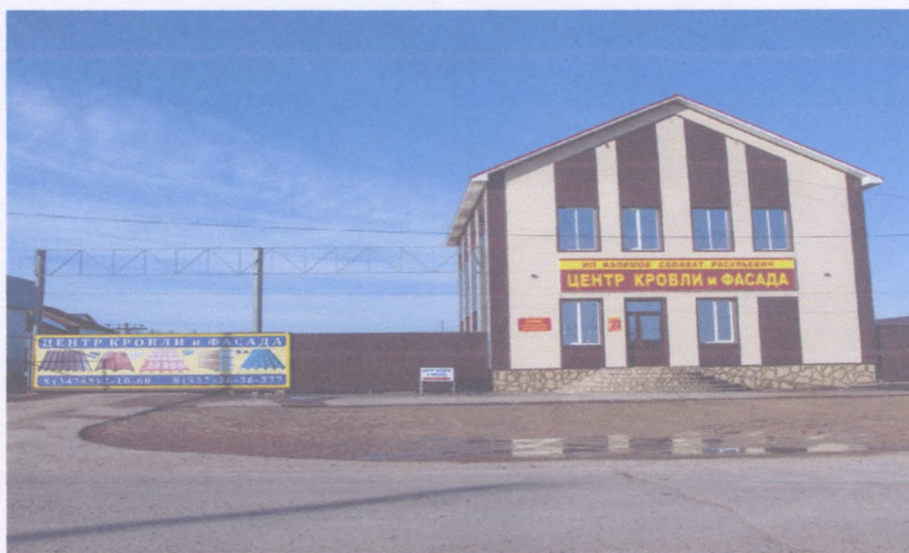
Рисунок 4 ИП Халимов С.Р «Центр кровли и фасада»

Итого инвестиции с учетом субъектов малого предпринимательства составили 436,591 млн.руб. или 122,37 % к 2017 году, увеличение в 2,1 раза к 2015 году (205,4 млн.руб.).