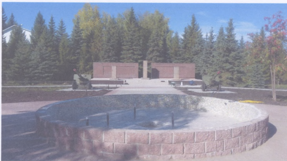
Рисунок 10 Благоустройство сквера

В завершении остается смонтировать закупленное генподрядчиком специальное оборудование фонтана, монтаж парапетной крышки фонтана. Доплатить 70 % за уличные фонари «Пушкин-2»-38 шт. , скамьи -6 шт., урны 6 шт. с последующей установкой. Посадка кустарников -222 шт. и посадка луковичных цветов.