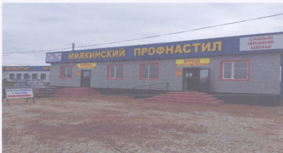
Рисунок 5 ИП Нургалева А.В. Миякинский ПРОФНАСТИЛ