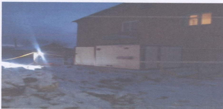
Рисунок 9 Установка блочной газовой котельной и переход на поквартирные системы отопления в с. Родниковка

Стоимость объекта составил 14 400,519 тыс. руб.