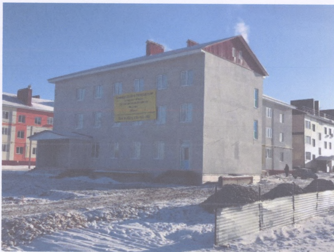
Рисунок 3 Многоквартирный дом мкр. Южный с.Киргиз-Мияки (застройщик ООО «СМУ-4»)

Число жителей, находящихся в очереди на улучшение жилищных условий – 521.