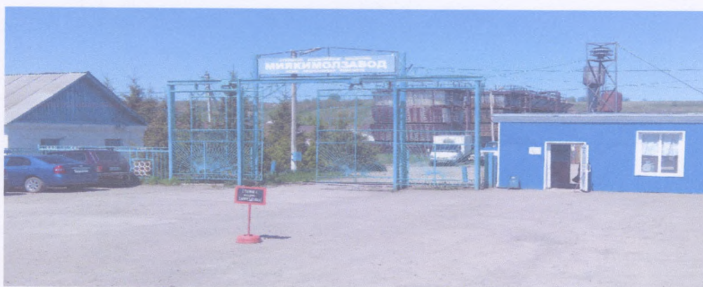
Рисунок 2 АО Миякимолзавод

Ведущим промышленным предприятием района является Акционерное общество «Миякимолзавод».