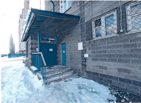
Помещение № 13, площадью 9,1 кв.м.