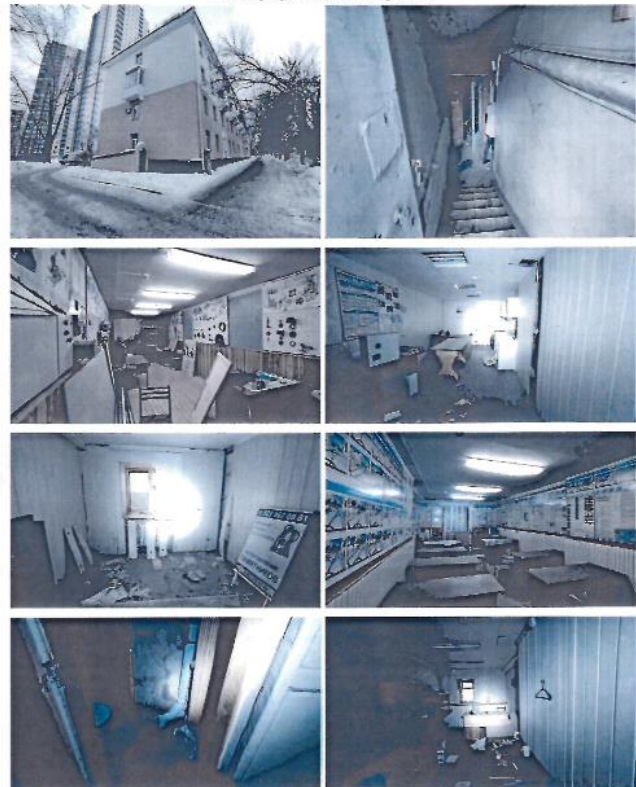
Фотографии объекта аренды

Состояние объекта аренды определено экспертно на основании таблицы, представленной ниже.