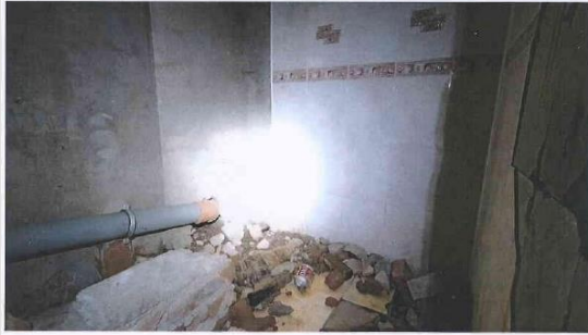
Фотографии объекта аренды