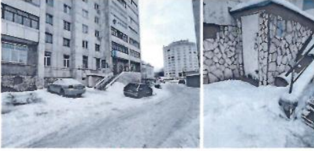
Фотографии объекта аренды